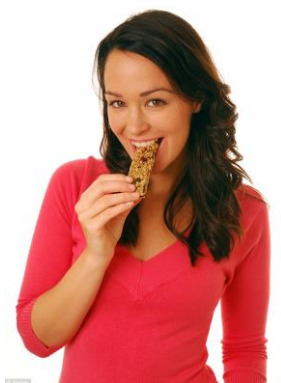
Les collations en barre sont plus populaires chez les femmes que chez les hommes