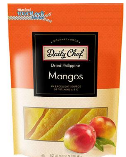
Mangues séchées comme en-cas santé chaque jour

Nouveauté des fruits séchés « moelleux ». Les fruits séchés au soleil, sans additifs peuvent être particulièrement secs, avec une texture de « cuir » qui nécessite de mastiquer pendant un certain temps pour être ramollie, et qui peut abîmer les dents des consommateurs. Récemment, des fruits séchés sans conservateur ont été lancés, par ex. des abricots moelleux. Ils sont légèrement réhydratés pour leur redonner une saveur « fraîche », les rendre moelleux et juteux. Ce point peut être étudié lors du développement de nouvelles techniques de séchage des mangues séchées.