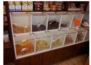
Mangues séchées en vrac chez primeur

Les mangues séchées biologiques provenant du Burkina Faso sont principalement vendues dans des magasins ou petits supermarchés bio, par ex. Biocoop , Artisans du Monde . On peut également les trouver aux rayons alimentaires de chaînes de bien-être et nature, comme par ex. Nature ou des jardinerias.