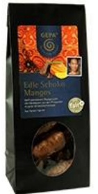
Mangues enrobées au chocolat (GEPA)

Par ailleurs, les principaux producteurs poursuivront leurs investissements dans des programmes concernant la durabilité, incluant le chocolat éthique et biologique, combiné ou non à des fruits tropicaux séchés comme la mangue. Étant donné le succès remporté par le chocolat issu du commerce équitable, la durabilité et la traçabilité dans la chaîne de valeurs du chocolat devraient devenir des critères d'achat majeurs pour les consommateurs. Les mangues séchées peuvent être enrobées de chocolat et vendues tout au long de l'année dans des emballages luxueux ( voir ici ) ou conditionnées spécialement pour Noël ou la Saint Valentin.