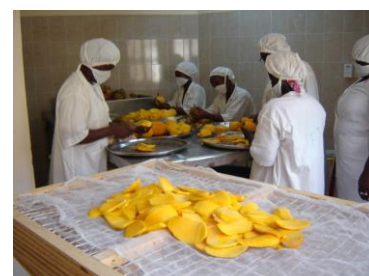
Découpe de mangues en tranche

Depuis le petit exploitant jusqu'au transformateur. Comme nous le montre la figure 1, les mangues destinées à être séchées sont fournies par les petits exploitants. Ceci inclut souvent des mangues qui ne sont pas retenues pour l'export. Elles sont ensuite transportées chez le transformateur, où elles sont coupées en tranches et séchées dans des fours.