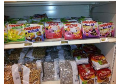
Mangues en mélange avec d'autres fruits

Si vous ciblez les entreprises agroalimentaires, il faut savoir qu'elles cherchent de plus en plus à travailler en direct avec les exportateurs des pays en développement pour obtenir un meilleur prix et s'assurer des approvisionnements réguliers.