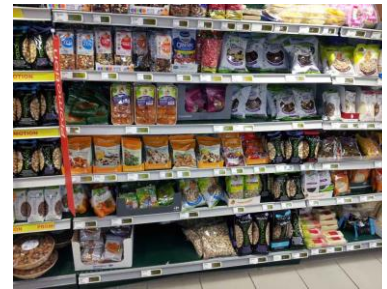
Rayon des fruits séchés et noix (Carrefour)

Une présentation des principaux supermarchés/hypermarchés des pays de l'UE et la part de la distribution dans les pays de l'UE peut être consultée dans le module « Circuits commerciaux et segments de marchés des mangues fraîches ».