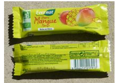
Barre à base de fruits et de mangue biologique (Evernat)