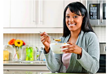
Un régime sain adapté à la perte de poids

Le marché de la collation saine étant concurrentiel, les entreprises de fruits séchés font de plus la promotion de « collation planifiée ». Par exemple, en ajoutant des fruits séchés dans la pause déjeuner au travail, à l'école, en randonnée ou en voyage. S'il y a toujours un sachet de mangues séchées dans la boîte à gant de la voiture, on aura moins tendance à s'arrêter à la prochaine station essence pour se faire plaisir et se caler avec un paquet de chips ou de bonbons.