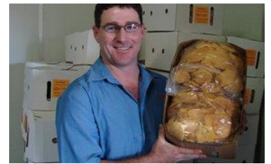
Un importateur vérifie la qualité

L'importateur vérifie la qualité à l'arrivée des mangues séchées. Il est établi par son propre inspecteur qualité, ou par un spécialiste engagé (par ex. un courtier, un agent ou un consultant) qui émet un rapport de qualité qui sert de base pour le règlement final à l'exportateur. Ensuite, l'importateur organise le transport en camion jusqu'à son propre centre de distribution, ou jusqu'au centre de conditionnement avec lequel il collabore.