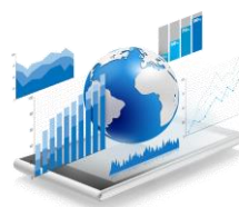
Tableau 1 : Nouveaux partenaires potentiels pour le marché du miel

Sur la base de l'étude réalisée par la FAO sur l'analyse du potentiel de diversification des produits agricoles au Burkina Faso, les nouveaux partenaires suggérés pour l'exportation du miel selon leur degré de dynamisme sont consignés dans le tableau ci-après :