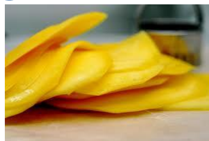
Tranches de mangue

Les mangues séchées sont consommées en tranche comme en-cas (seules ou en mélange), ou utilisées dans le secteur de la transformation alimentaire, notamment dans les céréales du petit-déjeuner et les barres énergétiques, très populaires au Royaume Uni, le plus grand marché de l'UE.