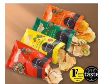
Chips de fruits séchés (Nimms)

Le Royaume Uni est le second importateur majeur de fruits séchés de l'UE (38 394 tonnes en 2012), avec une part assez importante de mangues séchées (voir tableau 1). Tout d'abord, les mangues séchées sont utilisées dans les céréales, qui