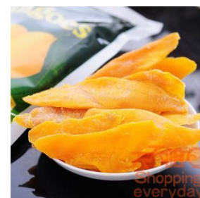
Mangues séchées des Philippines

Une indication générale des importations de mangues séchées peut également être dérivée des statistiques données dans le module « Europe : des marchés prometteurs pour l'export des mangues fraîches ».